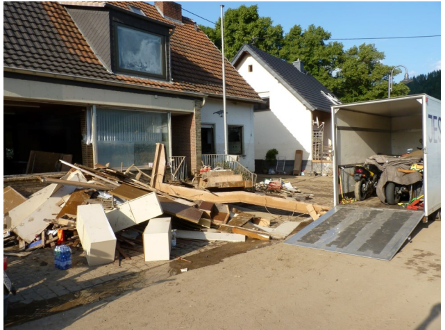
Zerstörtes Gebäude in Adenau